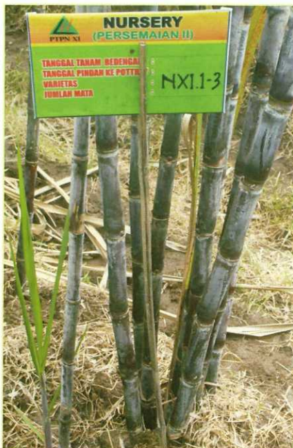
Gambar 3. VMC 86-550

Tentunya sudah tidak asing lagi dengan Jenis tebu berjuluk N XI 1-3 atau dengan nama resmi saat perilisan VMC 86-550.