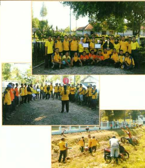
Gambar 1. Karyawan Puslit Sukosari dalam jumat bersih 19 Agustus 2016

In House Keeping tahun 2016 menjadi salah satu program PTPN XI yang dilakukan selama 3 bulan (Juni s/d Agustus 2016) diseluruh unit kerja dan kantor Pusat di lingkungan PTPN XI.